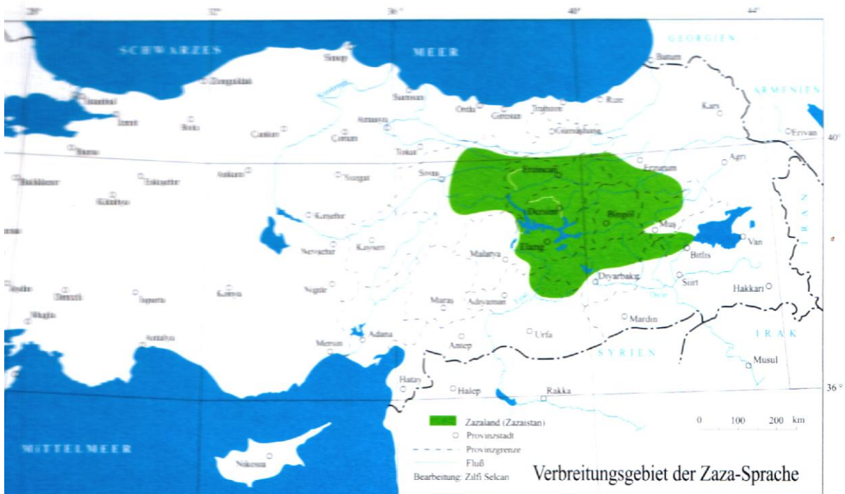
Abb. 2 Zazagebiet in der Türkei nach Selcan(1998) 12